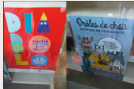
Affiches autour de l'école