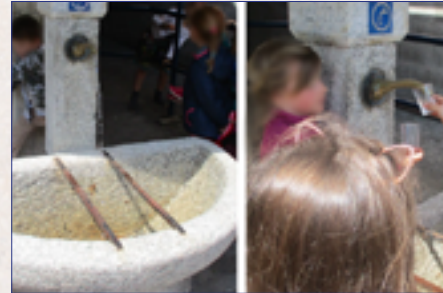
Elèves autour de la fontaine